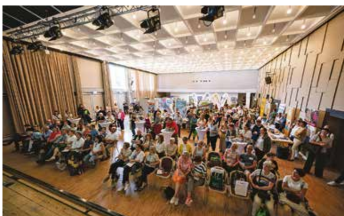
Über reges Interesse freuten sich...

Die Resonanz war durchweg positiv, weshalb sich die Tourismusdestinationen jetzt schon einig sind: Die gemeinsame Gastgeberwoche geht 2025 in die nächste Runde.