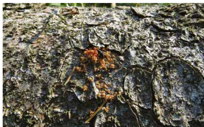
Der Borkenkäferbefall kann frühzeitig am rot-braunen Bohrmehl erkannt werden