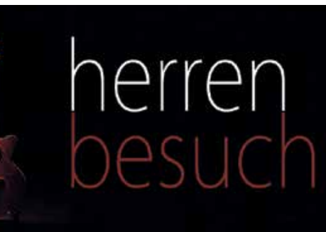
Open Air (nur bei guter Witterung)