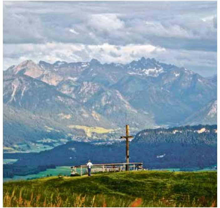
1. Genusspunkt: die Aussicht auf dem Hörnerpanoramaweg

Weitere Details, Ausrüstungsempfehlungen und noch verfügbare Plätze findet man unter hoernerdoerfer/allgaeu-erlebnisse/10-stunden-wandererlebnis