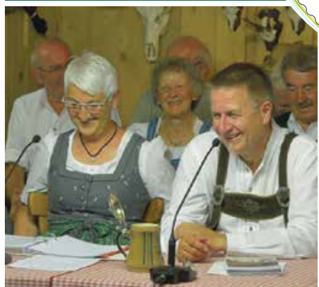
loose - sinne - lache