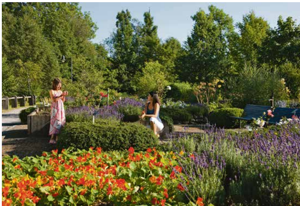
Duftend und lehrreich. Die Kräutergärten der Hörnerdörfer