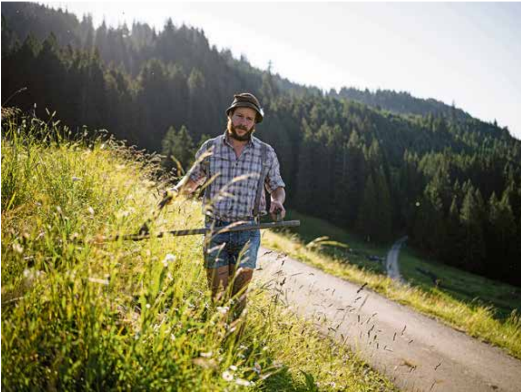
Eine blühende Bergwiese – für die einen Alltag für die anderen Urlaub