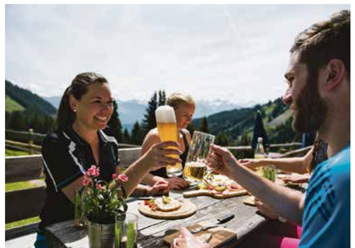
Das Beste am Berg: Einkehr mit Aussicht

Wenn der Mensch einen Berg sieht, will er hinauf. Ist er dann oben, bekommt er Hunger und Durst. Praktischerweise ist in den Hörnerdörfern die nächste Alpe nie sehr weit und die Äpler stets zur Stelle, um Wandernde mit deftigen Brotzeiten und kühlen Getränken vor der schieren Entkräftung zu bewahren. Auf Senn-