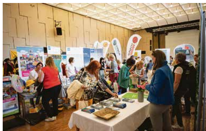
...und 35 ausstellende Freizeitanbieter