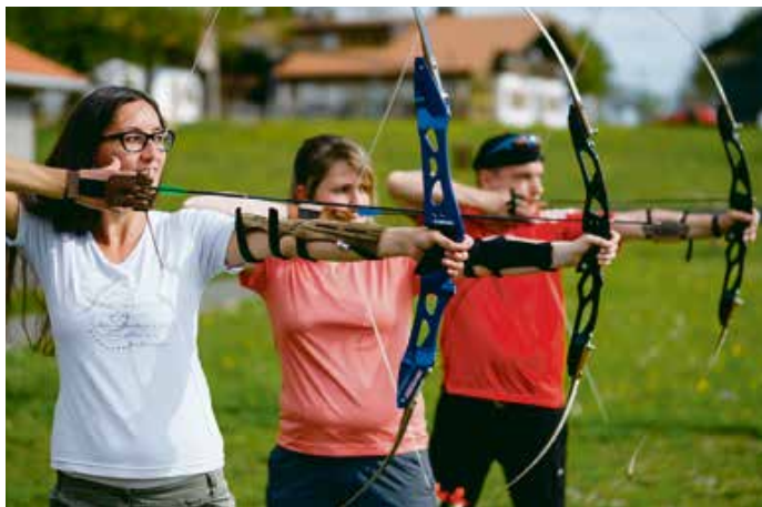
Ganz schön spannend, die Entspannung

Gänsehaut bekommt man von Minusgraden. Oder von Hochspannung. Die Bogentrainer in Bolsterlang setzen auf die zweite Variante. Die modernen Recurve-Bögen und Carbonpfeile sind leicht und auch für Anfänger und größere Kinder schnell zu handhaben. Die Herausforderung beim Bogenschießen liegt nicht im Material, sondern im Kopf – ganz ruhig werden, voll konzentriert und maximal fokussiert. Auf dem wettergeschützten Bogenübungsplatz, auf den Wiesen im Talparcours oder auf dem Trail am Bolsterlanger Horn.