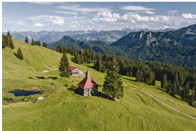
Sommerfrische soweit das Auge reicht: Hier von der Piesenalpe aus

Vielleicht ist eben dies das Geheimnis der Sommerfrische in den Hörnerdörfern. Man tut, was zu tun ist, man geht seinem Tagwerk nach. Das Leichte und Frische ergibt sich dann. Weil man's gern macht.