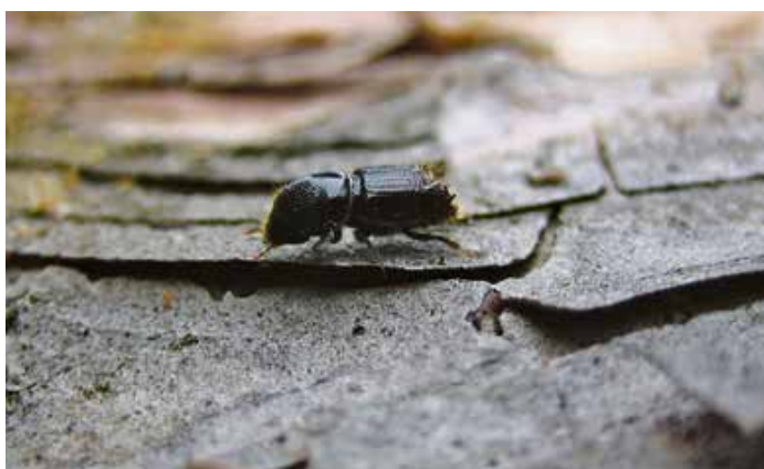
Der nur wenige Millimeter große Buchdrucker kann ganze Fichtenwälder vernichten