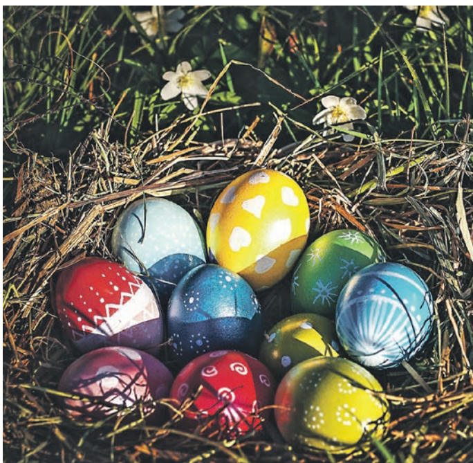
Süßigkeiten-Vorrat aufgefüllt. Osterhas, Du bist der Beste!

Alles in allem, spricht dann doch einiges für die Frühlingsverehrung. Der Zauber eines neuen Anfangs zeigt sich nirgends so deutlich wie in der knospenden, aufblühenden, jubilierenden Natur im jungen Jahr. Die Kraft und Lebendigkeit um uns herum sehen wir nicht einfach, wir spüren sie am eigenen Leib. Das Osterfest – die Feier der Auferstehung – erzählt längst davon: Im Frühling sind Tod und Dunkelheit besiegt, die Welt ist neu. Zeit, sie zu entdecken. Für den Anfang sind die Hörnerdörfer eine gute Wahl.