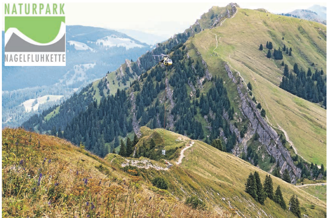
Auch in diesem Jahr sollen wieder zwei weitere Wegeabschnitte auf der Nagelfluhkette saniert werden.