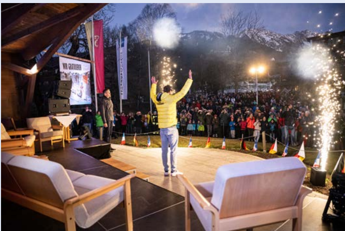
Über 1000 Besucher empfangen den Weltmeister