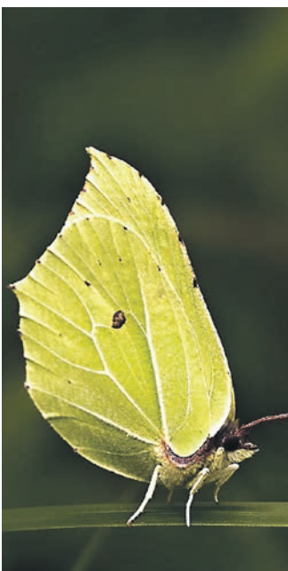
Braucht jetzt keine Frostschutzmittel mehr. Der Zitronenfalter.

Erwacht der Mensch nach gutem Schlaf, wird er sich stre-