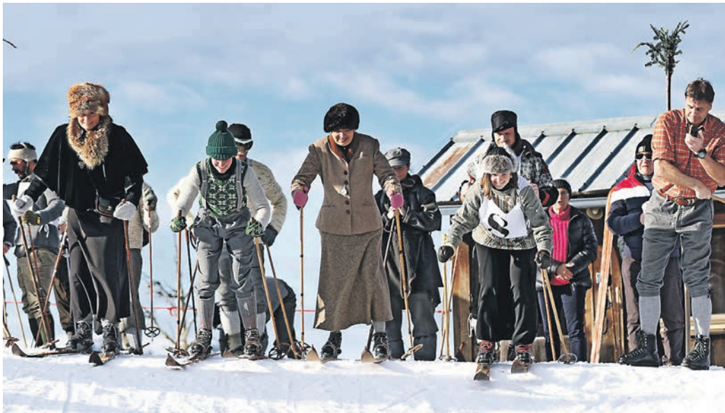
Historisches Skirenennen in Fischen

bilderbuchreifen Sonnen-Pisten, Ofterschwang verzauberte zwei Tage später mit Begrüßungssekt zu Alphornklängen und in Fischen verwandelte sich beim Historischen Skirenennen am 11. Februar das Familienskigebiet Stinesser in eine Abfahrt wie vor 100 Jahren.