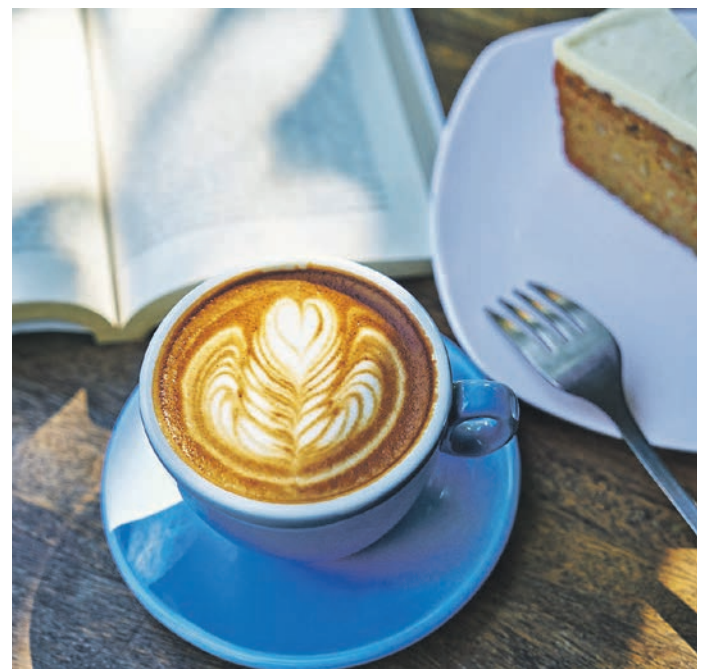
Endlich wieder draußen genießen.