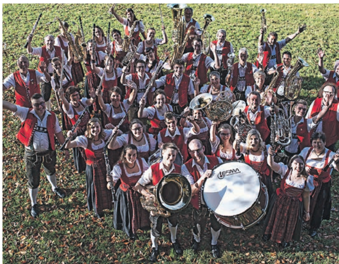
Herbstkonzert Musikkapelle Fischen

Samstag, 15. Juli 2023: Konzert der Musikkapelle Innsbruck-Wilten in der Fiskina, Fischen