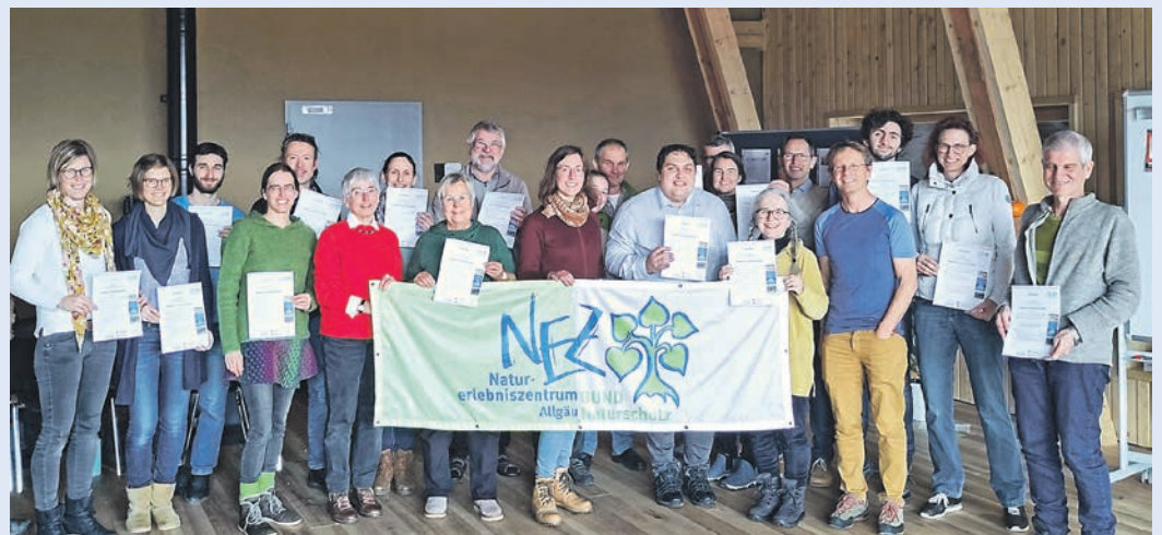
30 Teilnehmende wurden vom Naturerlebniszentrum Allgäu zum Allgäuer Klimabotschafter ausgebildet.

über eigene öffentliche Klimaschutzvorträge bis hin zur Umsetzung von Klimaschutzmaßnahmen in Vereinen und zum Einbringen konkreter Initiativen. An den fachlichen Inhalten der Ausbildung wirkten neben Mitarbeitern des NEZ mehrere Referenten des Energie- und Umweltzentrum Allgäu (eza) mit. Die Ausbildung wurde gefördert von der deutschen Postcode-Lotterie sowie vom Landkreis Oberallgäu und der Stadt Kempten.