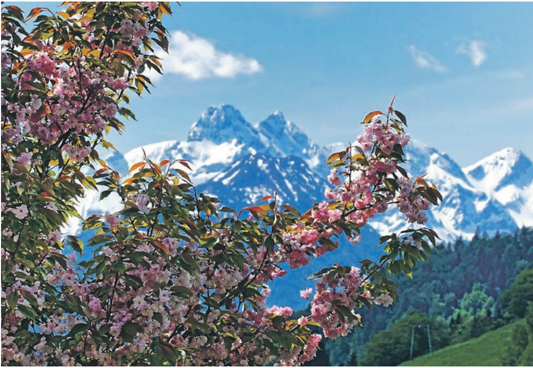
Der erste Blütenduft liegt in der Luft.

erscheint, sollte keinen derart großen Fanclub haben. Ist aber ganz offensichtlich so. Lyrik und Literatur feiern den Lenz, die Menschen strömen hinaus ins Freie, als hätten sie Jahre der Kerkerhaft hinter sich und noch das kleinste Stummchen scheint ein verliebtes Grinsen auf dem Kieselgesicht zu tragen. Warum also? Weil der Frühling große Versprechen macht. Der Frühling verspricht