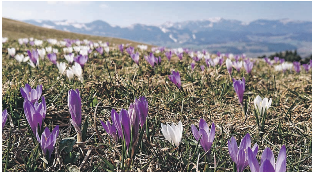
Zarte Farben, viel Licht. Zeit für große Gefühle.

Völlig egal, ob der Winter lang, kalt und klirrend oder einfach nur traumhaft schön war – ab März wartet der Mensch auf den Frühling und nimmt jeden Nachzügler-Wintertag übel. Warum sind wir eigentlich so versessen auf den Frühling? Die Temperaturen sind recht wankelmütig (Wir erinnern uns an die Bauernregel „der April macht, was er will“), die Natur wirkt in ihrem Pastellkleidchen manchmal etwas blass und einerseits ist nichts mehr mit Skifahren, aber Baden geht auch noch nicht. Man könnte meinen, eine Jahreszeit, in der alles irgendwie erst so skizziert