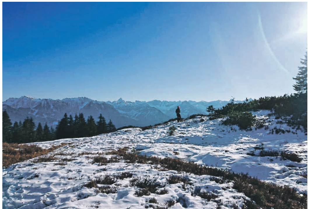
Einen neuen Rhythmus finden. Im Frühling. In der Natur.

Derzeit sind sogenannte „Smartwatches“ in aller Munde oder vielmehr baumeln sie an immer mehr Patschehändchen, die digitalen Zeit- und Lebensmesser. Auch aufgrund eines Versprechens; es lautet: Wenn