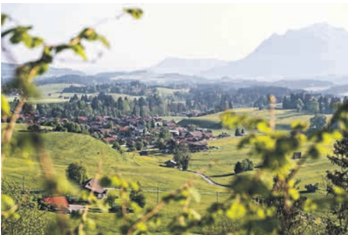
Obermaiselstein - Das HeimatDorf