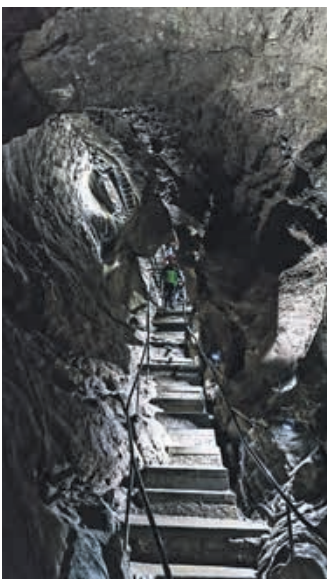
Die Sturmannshöhle bleibt garantiert der kühlsste Ort im Hörnerdörfer Hochsommer.

sind. Vor allem kühle Nächte sind eine Wohltat. Ich kann mit allem dienen!