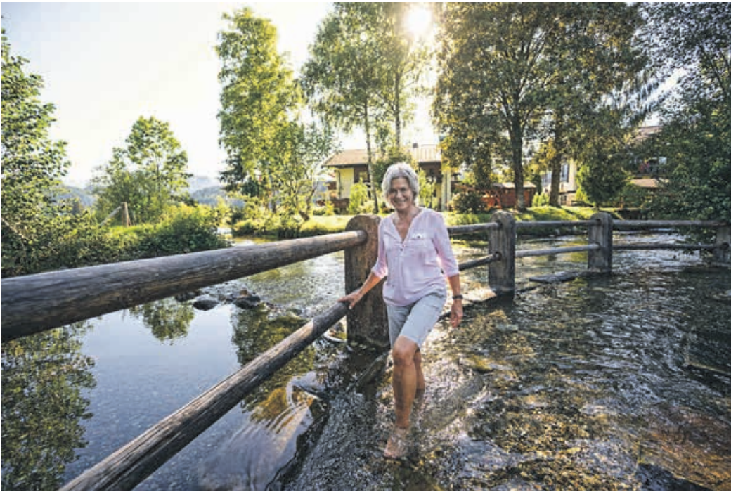
Erfrischung pur im Natur-Kneipp-Becken. Macht Spaß und fördert die Durchblutung