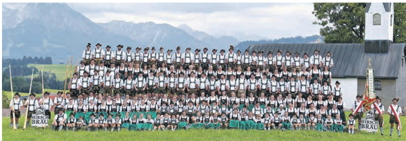
Trachtenverein D' Dörfler – bereit für ein großes Jubiläum. Das wird #abockfescht

Mehr zum Fest und den Festlichkeiten unter www.doerfler-bolsterlang.de .