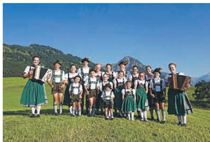
Plattler ist man von klein auf – die kleinen Plattler der Burgglöckler Au-Thalhofen 2023