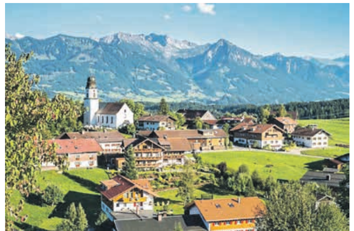
Ofterschwang - Das WeltcupDorf

Juchuuu, ich grüße! Hier oben bin ich, im Weltcup-Express. Steigt ein, denn oben wartet die Abwechslung. Auf meinem Hausberg, dem Ofterschwanger Horn, habt ihr erstens eine fabelhafte Aussicht und zweitens eine fabelhafte Auswahl: Wanderwege mit und ohne Gipfelanspruch, Disc-Golf und Downhill Roller und für die Kinder den Stuimändle-Weg mit spannenden Mitmachstationen. Wie bitte? Lieber unten bleiben? Dann lasst euch doch den Sommer einfach auf der Zunge zergehen. Bei mir gibt's „Gutes vom Dorf“ in deftig wie Räucherwurst, in würzig wie Käse, oder fruchtig wie Marmelade und ortsgebrannter Obstler. Alle Geschmacksrichtungen findet man übrigens auch im Eis aus der guten Heumilch meiner Kühe – na gut, Salami-Eis hatte ich noch nie im Sortiment, aber Enzianbrand oder Bergkäse