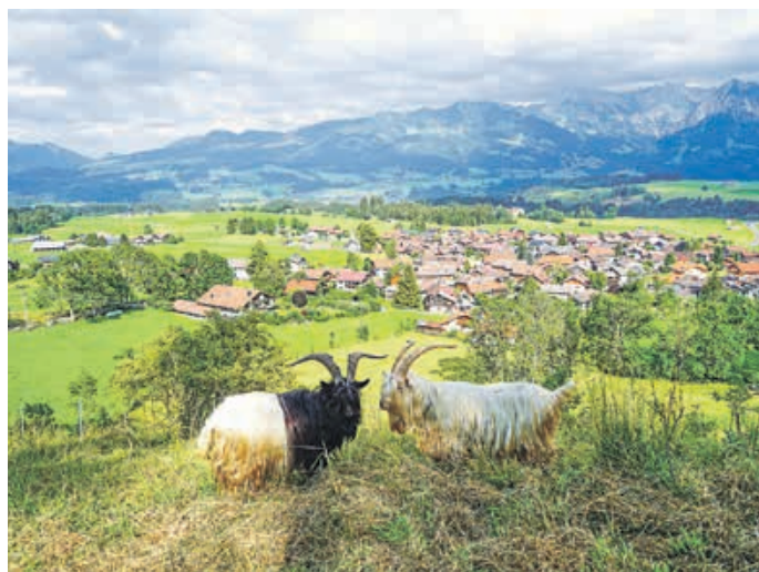
Das Markenzeichen der D' Dörfler: die Gaißen

Anstoß für den eigenen Verein war ein Streit um einen Preis beim Gautrachtenfest. Ob die Mannsbilder damals recht hatten? Kann dahinstehen, denn die Zeit hat ihnen Recht gegeben: Willenskraft und immer neuer, hoher Tatendrang bescherten in den folgenden Jahrzehnten der Chronik der Dörfler viele schöne Höhepunkte – von der eigenen Waldfestbühne über zahlreiche gemeinsame Feste, Plattlerpreise, Auftritte bei Urlaubsfreunden im Mittelmärkischen bis zu einem neuen Gipfelkreuz auf dem Bolsterlanger Horn. Markenzeichen und bei allen großen Festen natürlich dabei: die Gaisböcke und der legendäre „Gaisentanz“. Um zu verstehen, welche herrlichen Kapriolen tief verwurzelte Geselligkeit schlagen, die Lust am Lachen und ein feines Gehör für Rhythmus und Musik, muss man nur auf die Zahlen schauen: Aus zehn plattelnden Gründern sind Kleine und Große Plattler, Jodler und Alphornbläser, Gaisar und eine Theatergruppe geworden. Summa Summarum über 500 Vereins- und Jugendmitglieder, also etwa die Hälfte der Einwohnerschaft Bolsterlangs. Darauf darf man stolz sein und das muss man feiern! „D' Dörfler Bolsterlang“ bitten zum Fest – das wird #abockfescht am ersten Wochenende im August.