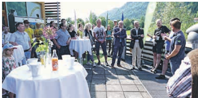
Eröffnung Tag der offenen Tür

lobten seine Entwicklung in den ersten 15 Jahren und wünschten dem Schutzgebiet nur das Beste für die kommenden Jahre. Der Naturpark dankt allen Partnern für ihr Kommen und den zahlreichen Besuchern und Besucherinnen!