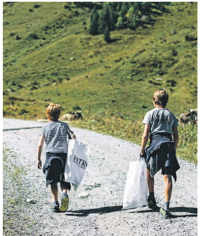
Von groß bis klein, alle packen mit an