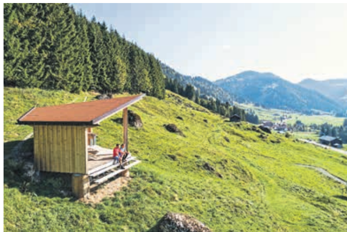
Balderschwang - Das AlpDorf

schön, zusammen zu feiern. Ein mitreißendes Stück Musik, ein gekonnter Plattler, ein fröhlicher Jodler, die heben ganz schnell die Stimmung und weil Bergluft bekanntlich mit der Höhe an Graden verliert, wird aus jedem Sommer-Fest ganz einfach eine Sommer-Frische.