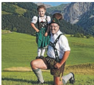
Zämedhold – jüing & old

G.T.E.V. „Burgglöckler“ Au-Thalhofen feiern 75. Jubiläum