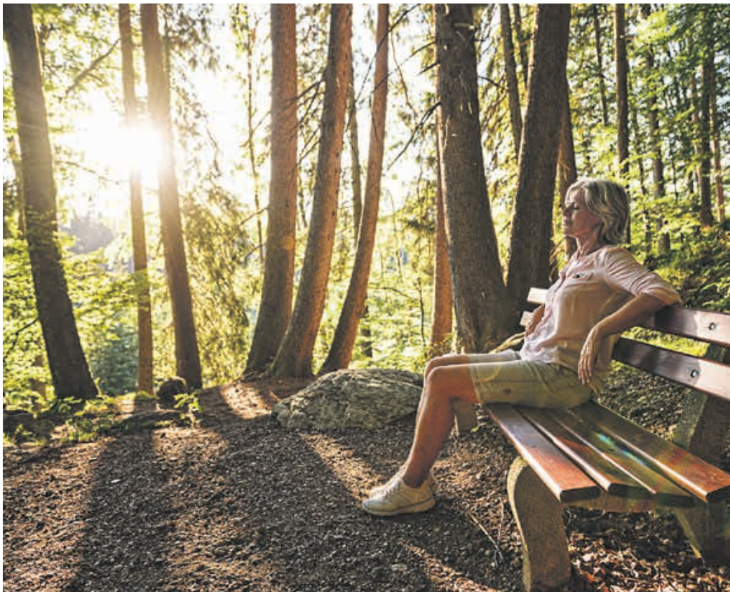
Fischens Magischer Ort: Hier heißt es einfach mal tief durchatmen.

Sommerfrische kenn ich mich aus. Als heilklimatischer Kurort der Premium Class, weiß ich genau, wie wichtig klare Luft und verträgliche Temperaturen