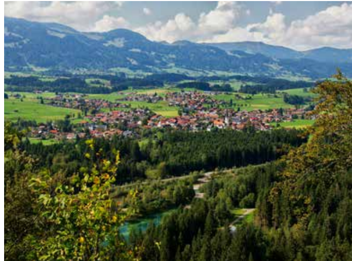
Fischen - Das NaturDorf

Wie stets im Sommer zur Urlaubszeit stellt sich die Frage: Wie wird das Wetter? Früher war das vor allem die Sorge, der Ferienbeweis auf der Haut könnte eher Rost als Sonnenbräune sein. Lange her, nicht wahr? Heute fürchten wir uns viel mehr vor UV, Ozon und eine Hitze, die jede Unternehmungslust verbrutzelt. Heute suchen Mensch und Sommer nicht nur Sonne, sondern vor allem Frische. Im Allgäu heißt es, sei diese sprichwörtlich etablierte Sommerfrische kein nostalgischer Ausdruck, sondern gefühltes Erlebnis und erlebtes Gefühl. Wir haben bei den fünf Hörnerdörfern nachgefragt, wie sie Sommerfrische leben und an ihre Gäste weitergeben.