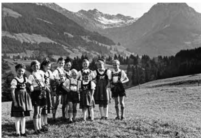
Die Jung-Plattler 1953 – schon damals wurde die schöne Kulisse des Rubihorns genutzt

Karten für Freitag, (Eintritt 3,00 €, Einlass ab 18 Jahren) und Samstag, (Eintritt 5,00 €, Einlass ab 16 Jahren) gibt es direkt am Zelt. Am Sonntag ist der Eintritt frei.