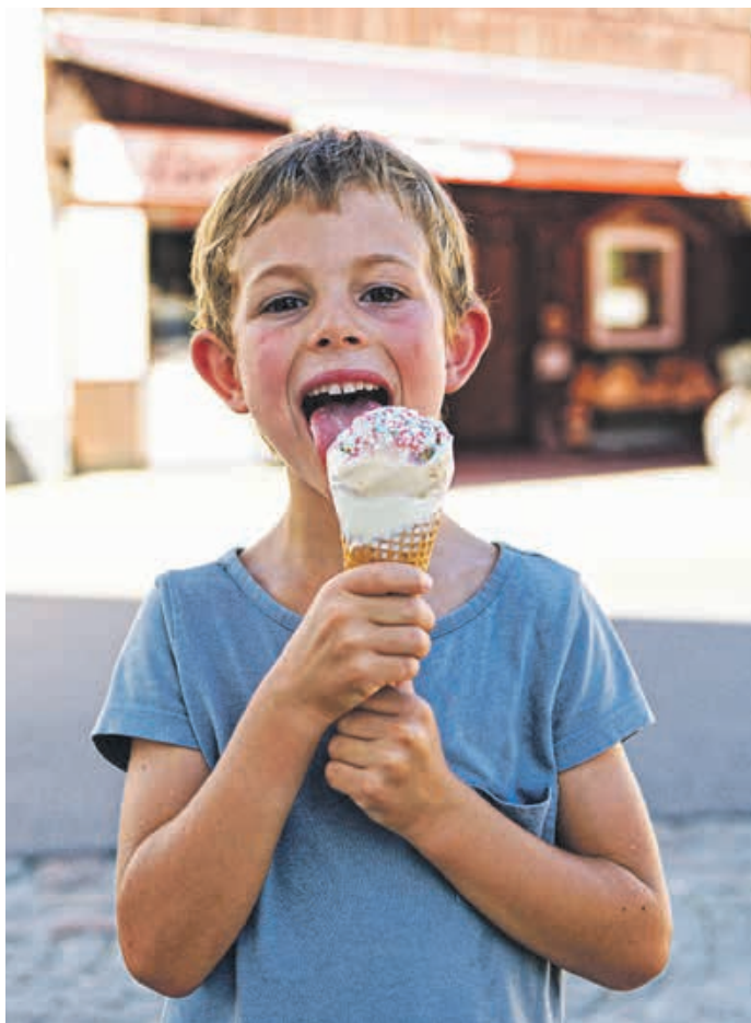
Lecker! Eisgenuss für jeden Geschmack

waren sehr beliebt. Lasst euch überraschen, was mein Eisladen heuer kreiert.