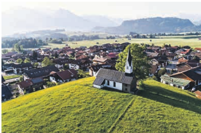
Bolsterlang - Das Bergdorf

Übrigen bin ich der Meinung, Erfrischung beginnt in den Mundwinkeln! Wo geschmunzelt, gesungen, gepfiffen und gelacht wird, da ist es gut sein – deshalb stehen bei mir besonders viele Blasmusik- und Standkonzerte, Grill- und Feierabendfeste und ein großes Jubiläum des Trachtenvereins im Kalender. Eingeladen sind alle, es ist ja für Jung und Junggebliebene, für Hiesige und Hereinspazierte gleichermaßen