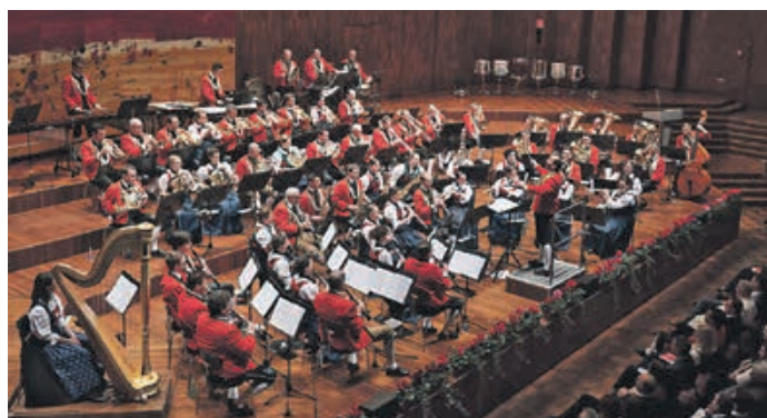
Ein Teil des großen Orchesters