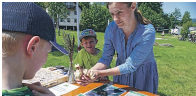
Wer ist denn hier gelaufen – Tierspurenrätsel bei den Junior Rangern

Die Ausstellung zeigt die vielen Facetten des Naturparks Nagelfluhkette und lädt die ganze Familie zum Entdecken ein. Die Naturpark-Erlebnisausstellung im Naturparkzentrum Nagelfluhkette in Immenstadt-Bühl ist täglich von 9:30 – 17:00 Uhr geöffnet.