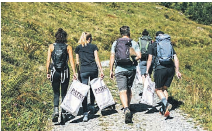
Auf geht's zu den 5.ten CleanUp Days im Allgäu

Als Highlight der Woche der Nachhaltigkeit bieten die Allgäu GmbH, die Stadt Kempten und der Patron e.V. mit dem FutureUP-Markt eine Austauschplattform rund um das Thema Nachhaltigkeit und ein verantwortungsbewusstes Verhalten in der Natur. Dieser findet am 15. Juli, von 9:00 – 14:00 Uhr, auf dem Residenzplatz in Kempten statt. In entspannter Atmosphäre soll Wissen an die Besucher vermittelt, gleichzeitig aber auch der Austausch untereinander gefördert werden. Abends wird der gemeinsame Erfolg im Künstlerhaus Kempten bei einem Konzert der drei Wiener Musikerinnen von „My Ugly Clementine“ gefeiert.