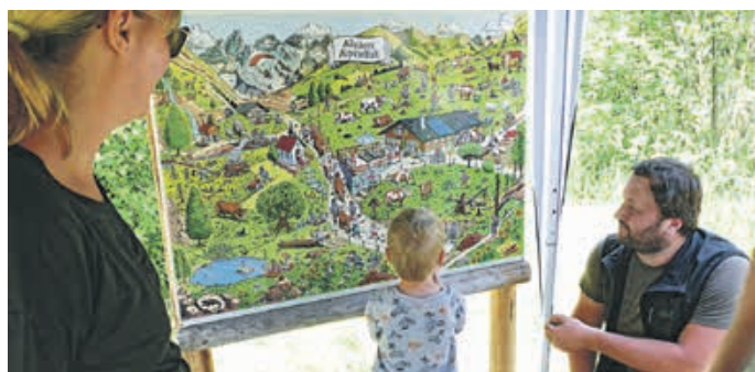
Wimmelbild beim Projekt Allgäuer Alpviefalt