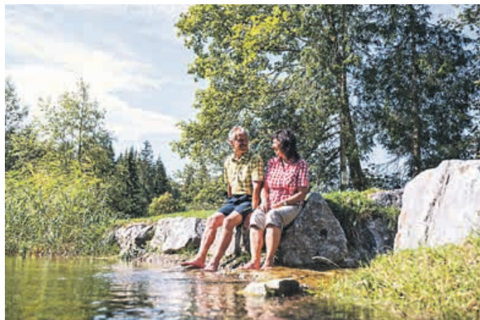
Im kühlen Nass die Füße baumeln lassen – einfach herrlich!