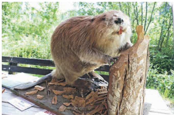
Biber zu beobachten beim Wasserwirtschaftsamt Kempten