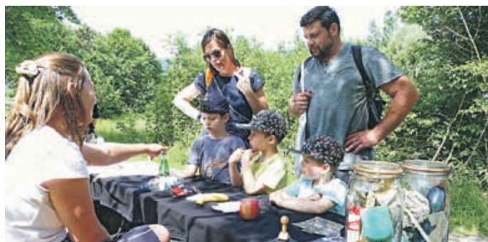
Hättet ihr's gedacht? – Verrottungszeiten beim Stand von Patron