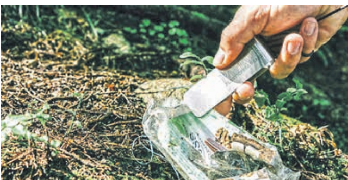
Euer praktischer Begleiter: Die PATRON-Zange aus Edelstahl