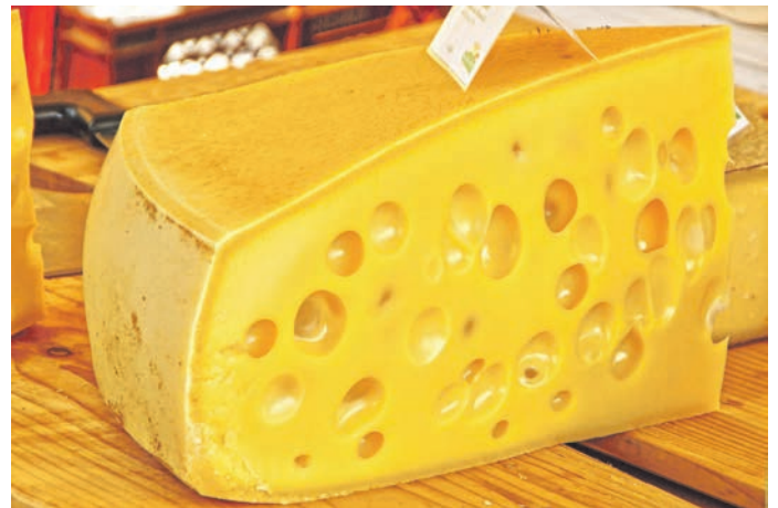
Das schmeckt Mensch und Maus: Allgäuer Emmentaler