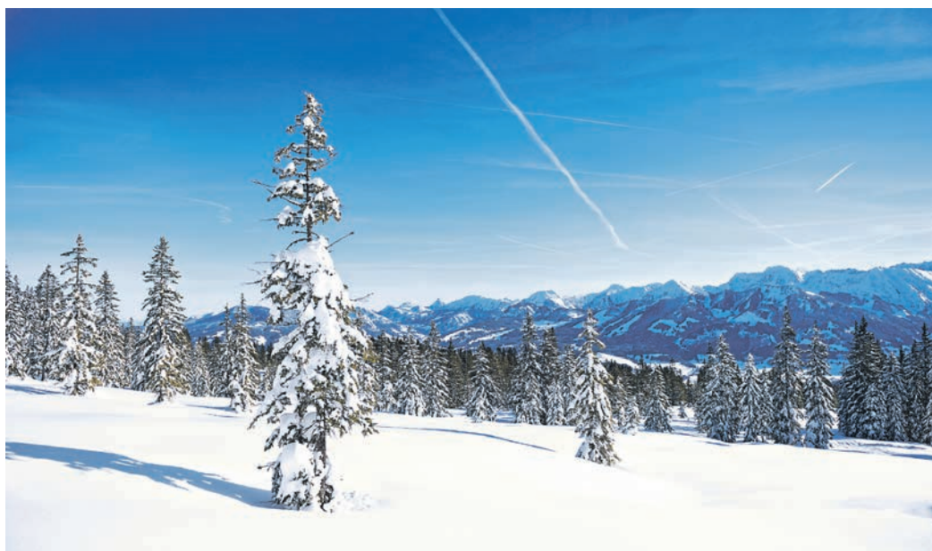
Weiß tut gut, Schneeweiß im Sonnenlicht tut besonders gut

Zuerst erreichte das Mädchen das Örtchen Fischen und als es den Marktanger betrat, traute es seinen Augen nicht. Riesengroße Käselaike rollten durch die Straßen, Teufel und Dämonen, Hexen, Musketiere und Flitterflatterschmetterlinge hüpfen, tobten, schrien und johlten zu Liedern aus Tröten und Trompeten. Mit jedem Trommelschlag kamen weitere eigentümliche, bunt bemalte Gestalten hinzu, die sich zu einem langen Zug formten und Karren, Kutschen, Dampfschiffe und sogar eine ganze Ritterburg mit sich zogen. Hier sind alle verrückt, dachte das Mädchen und fürchtete sich ein