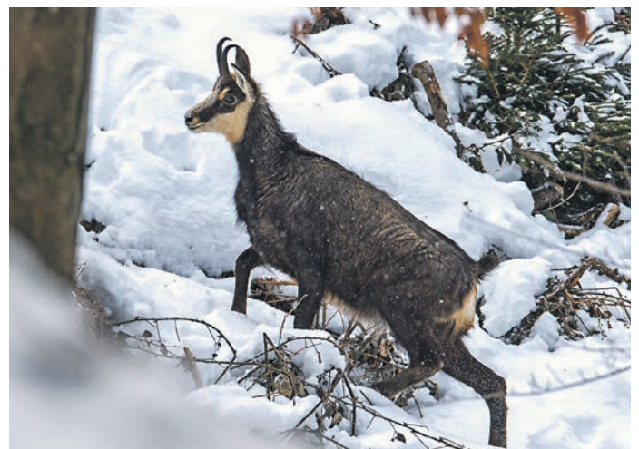
Die Gams gehört zu den winteraktiven Tieren