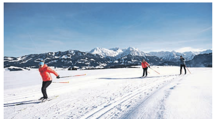
Langlauf bis zum Horizont und länger? In den Hörnerdörfern!

lernt – also musste es dort, am anderen Ende der Welt, statt Langeweile und Dunkeltrüb-nis viel Interessantes geben.