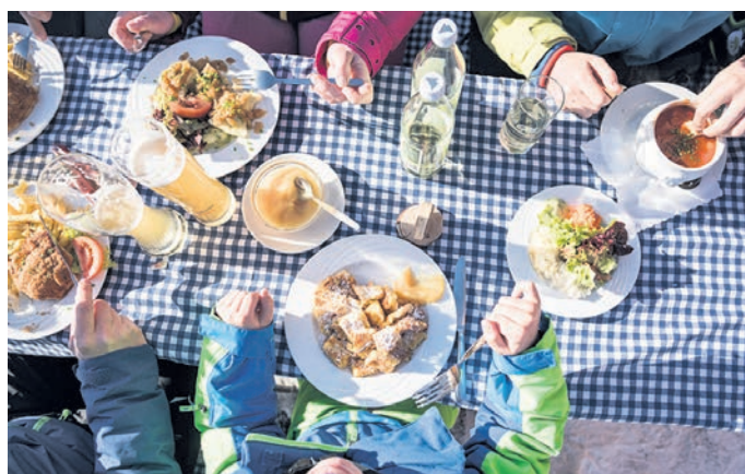
Ofterschwang – hier werden Feinschmecker glücklich