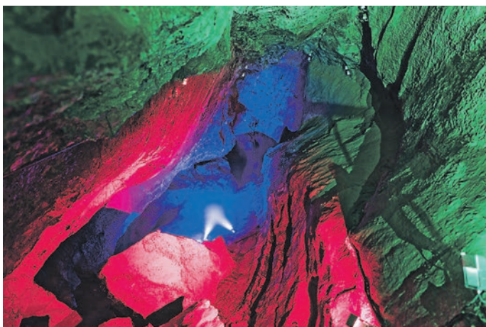
Märchenhafte Lichtspiele in der Sturmannshöhle