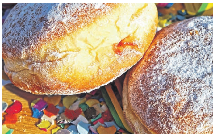
Süße Kanonenkugeln alias Allgäuer Faschingskrapfen

Das kleine Mädchen ging weiter und kam nach Ofterschwang . Hier lag ein leises Summen in der Luft, „Mhmm!“ Es klang, als würden sich unsichtbare Feinschmecker nach einem vorzüglichen Bissen über die Lippen lecken. Das kleine Mädchen traf eine dicke Tigerkatze und eine dicke graubraune Maus, die sich vor einer alten Scheunentür in der Februarsonne räkelten. „Gott zum Gruße, Frau Katze, Grüß Euch Gott, Frau Maus!“ sagte das Mädchen und fragte verwundert: „Ihr sonnt euch hier so einträchtig, das habe ich in meiner Stadt noch nie gesehen. Dort sind Katz und Maus sich spinnefeind.“ Maus und Katz nickten wissend und