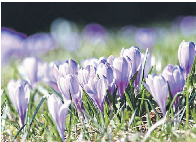
Krokus überwintern mit Hilfe ihrer Knolle

Mehr Infos unter: www.nagelfluhkette.info Viele weitere Infos zur naturverträglichen Tourenplanung auf www.freiraum-lebensraum.info