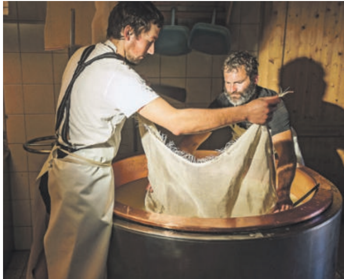
Guten Käse macht man viel Geduld und viel Handarbeit

Wenn im frühen Herbst die Rinder von den Bergweiden heimkehren, wenn Vihscheid ist im Allgäu, dann sind die Zeitungen voll davon. Bilder vom „aufgekranzten“, sprich bunt geschmückten, Vieh von kernigen Älplern und den Fehla, also den Mädels in Tracht auf allen Kanälen. Lachend, fröhlich, mit Blasmusik und Bierkrug... so zeigt man das Bergbauernleben gern und zeigt es doch nicht ganz richtig. Denn den Vihscheid feiert man einen Tag lang, aber dafür muss vorher 100 Tage gearbeitet werden.