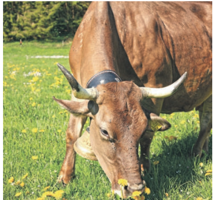
Kräuterreiche Weiden, Licht und Luft – das gibt besonders gute Milch.

Warum lassen sich die Hörnerdörfer bei „Senn auf Zeit“ in den Kochtopf, pardon in den Käsekessel schauen? Warum lassen sie zwei „Stadtmenschen“ vom Älplerleben in Wort und Bild berichten, auch