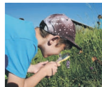
Bei den Forschertagen die Natur entdecken

oder man sich gemeinsam um Moore und Birkhühner kümmert. Einen Blick hinter die Kulissen darf man beim „Tag des offenen Naturparks“ am 11. Juni werfen und viele der Akteure im Naturpark kennenlernen. Anschließend dreht sich alles um Holz und Bäume, etwa in der „Themenwoche Wald“. In den Sommerferien sollen wieder die begehrten Junior Ranger Ausbildungen stattfinden. Kinder zwischen 9 und 12 Jahren erkunden an drei Tagen die Lebensräume Wiese, Alpe, Wald, Moor und Wasser. Die tägliche Anfahrt und Abholung der Kinder erfolgt privat, Anmeldungen sind ab dem 30. Mai möglich.