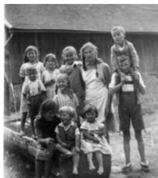
Am Dorfbrunnen trafen sich die Kinder

Auf der Brunnentour in Bolsterlang werden die Geschichten von Bolsterlang zum Leben erweckt: Die Anfänge des Tourismus, die Alpwirtschaft und der dörfliche Alltag sind Thema an den Infotafeln, die auf einem kurzen oder einem etwas verlängerten Rundweg