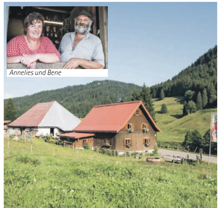
Sennalpe Schattwald im Rohrmoostal