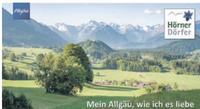
Hörnerdörfer-Imagebilder zeigen Bergpanorama und/oder Dorfidyll

Die Ergebnisse der Markendefinition sowie Erläuterungen zur Tourismusstrategie sind ab sofort für Gastgeber*innen in der Partner-Info der Homepage abrufbar.