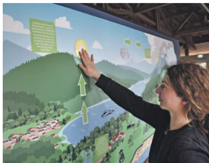
Die Sonne ist der Motor für unseren unaufhörlichen Kreislauf des Wassers. Und dennoch haben der Hitzesommer 2018/2019 gezeigt: Auch bei uns kann das Wasser knapp werden.