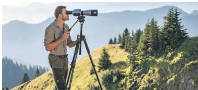
Spannende Einblicke: „Mit dem Ranger unterwegs“

Sehen, Staunen, Anpacken – im neuen Sommerprogramm warten über 55 spannende Veranstaltungen