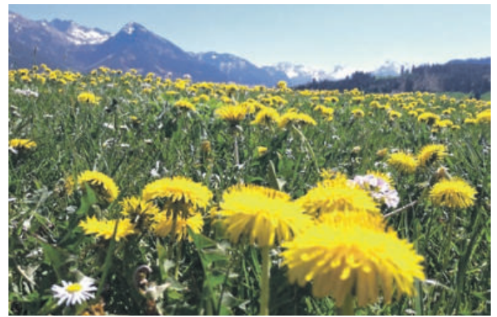
Die Natur leuchtet, der Alpsommer beginnt