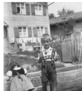
Man wusste immer, wo sie sind

durch Bolsterlang führen. Was man dort erfährt, darf man getrost auf die Dorfbrunnen der anderen Hörnerdörfer übertragen und Erfrischung ist einem an allen gewiss! Die genaue Wegbeschreibung gibt es online unter www.hoernerdoerfer.de/a-bolsterlang-brunnentour