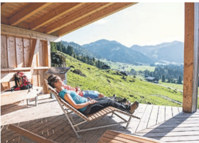
Lange Pausen – ein seltener Luxus bei „Senn auf Zeit“

Kein Haken. Höchstens ein Häkchen, so ein ganz kleines Komma oder eigentlich: Das Tüpfelchen auf dem i. Denn während Ihrer Woche auf der Sennalpe führen Sie Tagebuch. Sie berichten von Ihren Erlebnissen als „Senn oder Sennerin auf Zeit“ in unserem Hörner-Blog und dokumentieren Lieblingsorte, -tiere und -momente als Bild oder Video auf unseren Social-Media-Kanälen. Lassen Sie alle, die Interesse am echten Allgäu haben, teilhaben und schaffen Sie ein außergewöhnliches Zeitzeugnis.