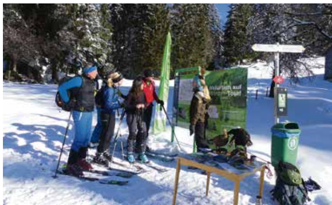
Im persönlichen Gespräch klären unsere Ranger:innen interessierte Skitourenger:innen über störempfindliche Tierarten wie das Birkhuhn auf.

Seit einigen Jahren ist der zunehmende Trend hin zu alternativem Wintersport wie Schneeschuhwandern im Gelände spürbar. Zusätzlich locken atemberaubende Darstellungen auf Social Media Plattformen immer mehr Menschen abseits der gesicherten Pisten in die freie Natur. Diese ist gleichzeitig der Winterlebensraum für störempfindliche Tierarten wie