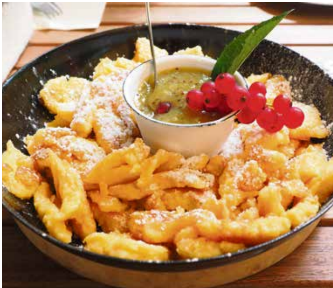
Eier in süßester Form: Allgäuer Kratzat.

Dafür verrührt man 120 g Mehl mit 250 ml Milch in einer Schüssel so lange, bis keine Klümpchen mehr zu sehen sind. 4 Eier, 50 g Zucker und eine Prise Salz wandern auch noch in die Schüssel und werden mit einem Schneebesen ordentlich aufgeschlagen, bis ein sämiger, dünnflüssiger Teig entstanden ist. In einer großen Pfanne lässt man einen ordentlichen Stich Schweineschmalz oder Butter oder Butterschmalz bei großer Hitze schmelzen und gießt den Teig hinein, wenn das Fett ein wenig simmert. Dann gleich die Temperatur etwas runterschalten und den Teig einige Minuten stocken lassen. Sobald der Rand fest wird – in der Mitte darf er noch flüssig sein – wird mit einem Pfannenwender