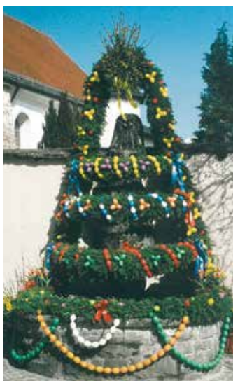
Wasser, Immergrün und bunte Eier – geschmückte Osterbrunnen.

Es folgt eine Unterrichtsstunde in Oberallgäuer Mundart. Heute: Krönzer Wieber. Krönzer Wieber sind Frauen, die krönze, das heißt Kränze binden können. Damit sind natürlich keine kleinen, dekorativen Tischkränze gemeint, sondern große Reigen für Hauseingänge, Kirchenportale oder eben jetzt im Frühling: für die Dorfbrunnen. Aufkränzen nennt man den besonderen Schmuck aus kunstvoll geflochtenen Zweigen und entsprechend besonders muss der Anlass sein, zu dem die Krönzer Wieber diese langwierige Handarbeit aufnehmen, denn vom Suchen über das Schneiden und Binden bis zum Schmücken lässt sich hier nichts maschinell erleichtern oder beschleunigen. So kommen die Frauen für Hochzeit, Taufe und Tod zusammen, oder eben für hohe Kirchenfeste. Dass zur Osterzeit nicht nur die Kirchen, sondern speziell die Brunnen mit immergrünen Kränzen geschmückt werden, ist ein starkes Symbol für die Kraft des Frühlings. Fließendes, sprudelndes Wasser als Zeichen der Reinigung, der Lebendigkeit, der neuen Lebenskraft. Ebenso steht das Grün von Weißtanne, Buchs, Thuja oder Ilex für eine Vitalität, die den Winter – den Tod – überdauert und zusammen mit den sanften Blüten der Sal-Weide, den Palmkätzchen, die Auferstehung in der Natur und im christlichen Ostergeschehen darstellt.