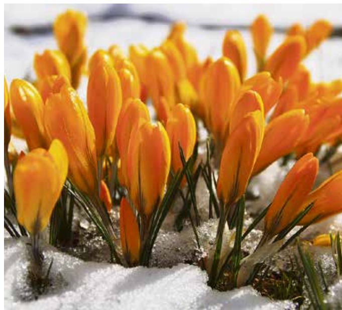
...selbst wenn manchmal noch Schneeflöckchen fallen.

Ei-chhörnchen – zugegeben, das ist jetzt schon etwas mühsam konstruiert, zumal die Hörnchen nicht mal Eier legen. Aber sie sind ein klarer Indikator für den Frühling. Denn was wäre der Frühling ohne Tiere? Unmöglich. Ein Frühlingstag ohne Summen, Zwitschern, Tschilpen? Unerträglich. Oder gar Ostern ohne Eier, Hasen und niedliche Lämmle? Schlicht undenkbar. Die Tiere zeigen uns erst so richtig, dass die Welt aus der Winterstarre erwacht ist und sich wieder regt und bewegt. Im Fischinger Weidach beobachtet man