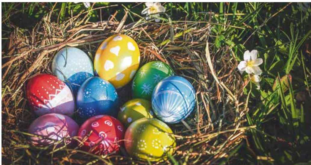
Gleicht ein Ei dem anderen? Nicht nur im Osternest ist die Vielfalt groß.