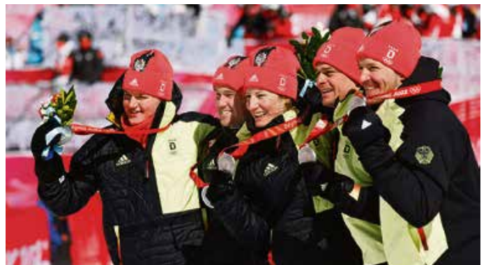
Von links: Emma Aicher, Julian Rauchfuss, Lena Dürr, Alexander Schmid und Linus Straßer.