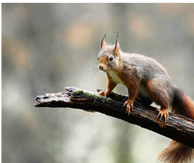
Freche Freunde – die Eichhörnchen im Weidach.

Nüsschen sind die bevorzugte Währung. Spontane Spaziergänger im Eichhörnchenwald können im Supermarkt am Eingang des Kurparks noch schnell Devisen tauschen.