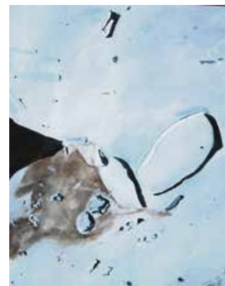
„Über dem Eis“ von Gundula Manson.