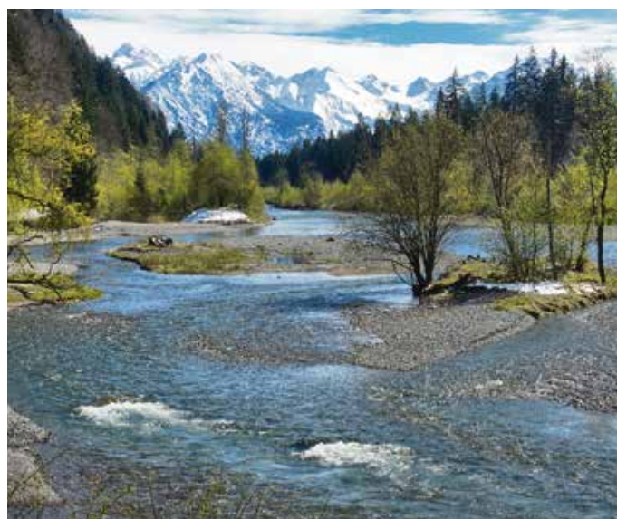
Vom Eise befreit. Endlich muss der Winter auf den hohen Gipfeln bleiben.