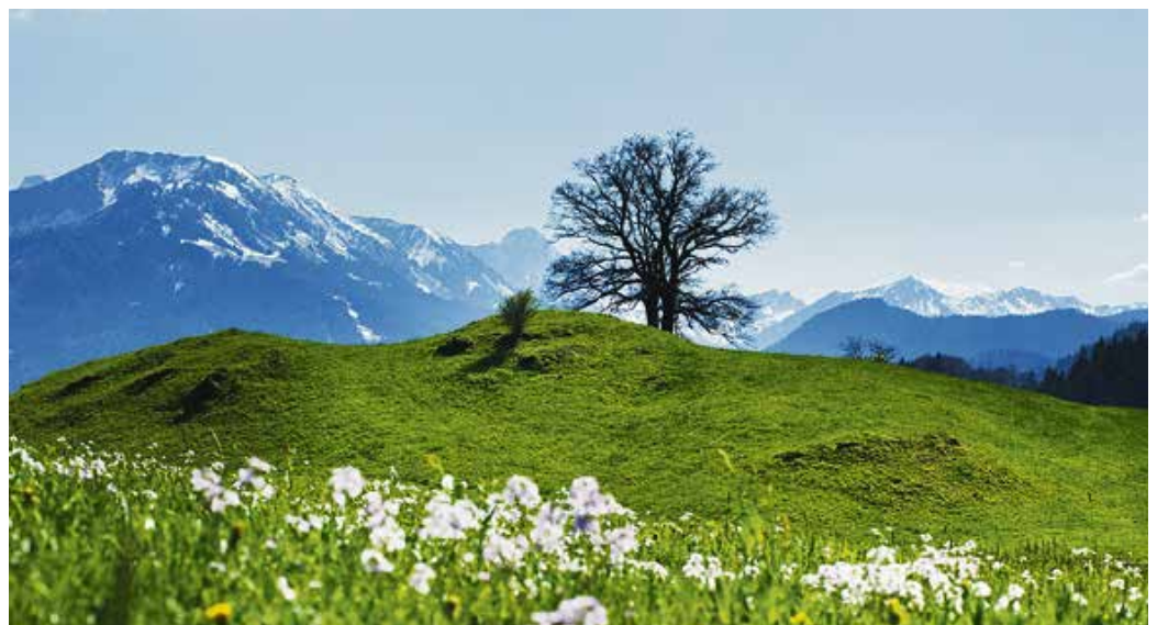
Panorama in Pastellfarben.