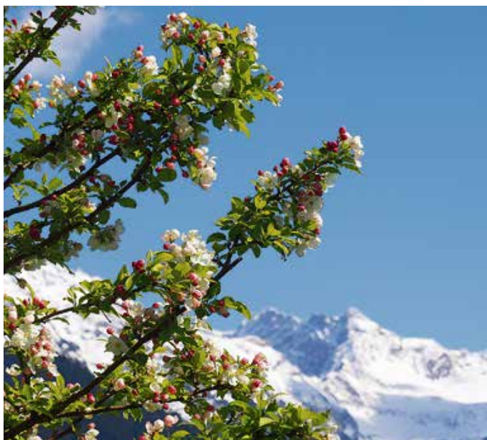
Im April gibt es für den Frühling kein Halten mehr ...

Auf den Brunnen wird das zu Strängen gebundene Grün zu einer Krone gefügt und mit bunten Eiern verziert. Auch wenn neuerdings gern auf den „heidnischen“, mithin vorchristlichen, Ursprung der bemalten Eier hingewiesen wird, einen Widerspruch zum österlichen Gedanken des neuen Lebens müsste man schon mühsam konstruieren – denn das Christentum, wie fast jede Kultur, jedes Zeitalter und jede Religion, kennt die Vorstellung vom Ei als Keimzelle von Leben und Wachsen. Frisches Wasser, leuchtendes Grün und bunte Eier, diese Kombination wirkt übrigens ganz intuitiv auf uns. Wir verstehen auch ohne jede theologische Vorbildung – aber, dass es die Krönzer Wieber sind, die in den Hörnerdörfern