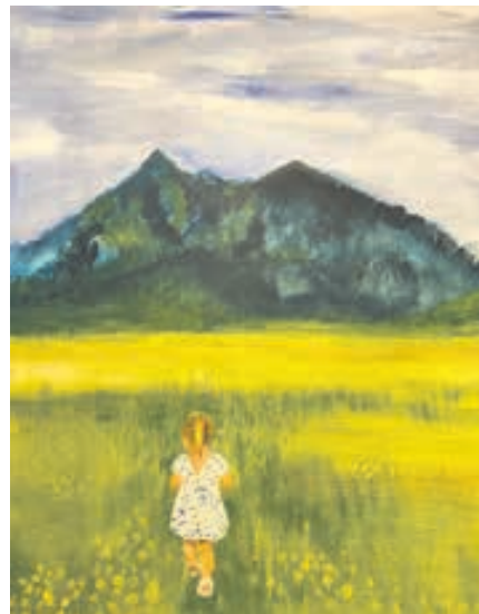
„Auf zum Grünen“ von Gabriele Sodeur

istische Figuren aus Ton, brennt und bemalt sie. Jede ihrer Figuren besitzt einen „individuellen“ Charakter, eine eigene Ausstrahlung. Manchmal ist Eberhards Blick auf die menschlichen Eigenheiten ein wenig satirisch, manchmal poetisch – stets aber ist er von einer freundlichen Grundstimmung getragen. Beim Anschauen der Figuren erlebt man immer wieder auch einmal ein „Déjà-vu“ – das Gefühl des