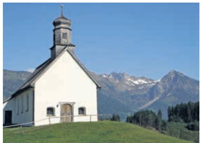
An Pfingsten ist Ostern vollendet. Zeit, den eigenen Weg zu überdenken

Der Mai bringt heuer ein zweites großes Fest mit. Pfingsten. Anlass ist die Bibelgeschichte von der Ausgießung des Heiligen Geistes und gemeinhin wird Pfingsten als der „Geburtstag der Kirche“ bezeichnet – damit ist die österliche Botschaft der Auferstehung vollendet. Jetzt heißt es, die Heilsgeschichte für sich zu erfahren und für andere erlebbar zu machen. Dazu steht in der christlichen Pfingsterzählung unter anderem: Kehret um! Doch diese schlichte Aufforderung ist durchaus mit Arbeit verbunden. Umkehren, ablassen, sich von gewohnten, aber eben ungunstigen Verhaltensmustern trennen, das ist gar nicht so leicht. Im Urlaub, zumal in einer zugänglichen und doch ursprünglichen Landschaft ist es einfacher. Die Natur macht es einfacher. Wind, Wetter, Duft und Farbe wirken belebend auf den Geist. Ruhe und Himmelsweite klären die Gedanken. Und man findet zahlreiche Angebote, die bei der eigenen Seelenarbeit Hilfestellung leisten. Yoga, Waldbaden oder eine Sagenwanderung können ganz unaufdringlich die richtigen Impulse liefern. Kehr um! Das ist in den Bergen auch eine ganz pragmatische Lektion, eine der wichtigsten überhaupt: Wenn das Wetter nicht hält, wenn du dich überfordert hast, darfst und musst du umkehren. Selbst das schönste Gipfelkreuz ist es nicht wert, einen verknacksten Knöchel zu riskieren. Bei geführten Berg- und Radtouren lernt man die Tücken des Geländes und des Bergwetters kennen, vor allem aber sich und seine Ressourcen richtig einzuschätzen. Arbeiten.