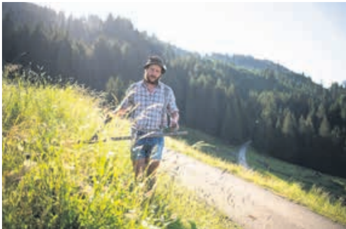
Alpwirtschaft. Viel Handarbeit, sehr viel Idealismus

Über 9.000 Gästebetten stehen in den Hörnerdörfern, damit ist die Bettenzahl gut 16 Prozent höher als die Einwohnerzahl. Will heißen, das Allgäu lebt bei weitem nicht nur von Käse und Kuhglocken. Viele Gewerbe sind hier ansässig und erfolgreich. Nicht zuletzt, weil Natur und Landschaft als Basis wertgeschätzt werden. Für regionale Produkte wie Milch und Fleisch und viele hochwertige Lebensmittel und als wichtiger Standortfaktor für weitere Branchen. Unter ihnen gibt der Tourismus zwar den Ton an, aber nicht als Solist, sondern immer im Ensemble. Familiengeführte Hotels, Ferienwohnungen im umgebauten Schopf des Elternhauses oder eine Zusatzqualifizierung als Wanderführer oder Kräuterexpertin sind ein gutes Indiz dafür, wie Gastfreundschaft und Dienstleistungsgewerbe verstanden werden. Man will das Gewachsene bewahren und für die Reize der Umgebung sensibilisieren. Es funktioniert, weil man nirgends in den Hörnerdörfern auf eine hohle Kulisse, auf pure Deko treffen wird. Steht da ein Traktor, wird er auch Bschitte, also Gülle, ausbringen. Liegt da ein Hammer, wird er einen Nagel, einen Pfahl, eine Wegmarkierung einschlagen. Und sieht man die Leute in Tracht, wird es irgendwo ein Fest zu feiern geben. Für die Gästebetten gilt deshalb Gleiches. Wo eines angeboten wird, ist man als Gast nicht kalkuliert,