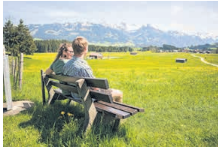
Den richtigen Ort finden. Zum Leben, Arbeiten und Urlaub machen

sondern von Herzen gern gesehen. Ob man es sich dann lieber im Spa-Resort, auf dem Bauernhof oder in der schnuckeligen Pension bequem macht, ist der eigenen Vorliebe überlassen.